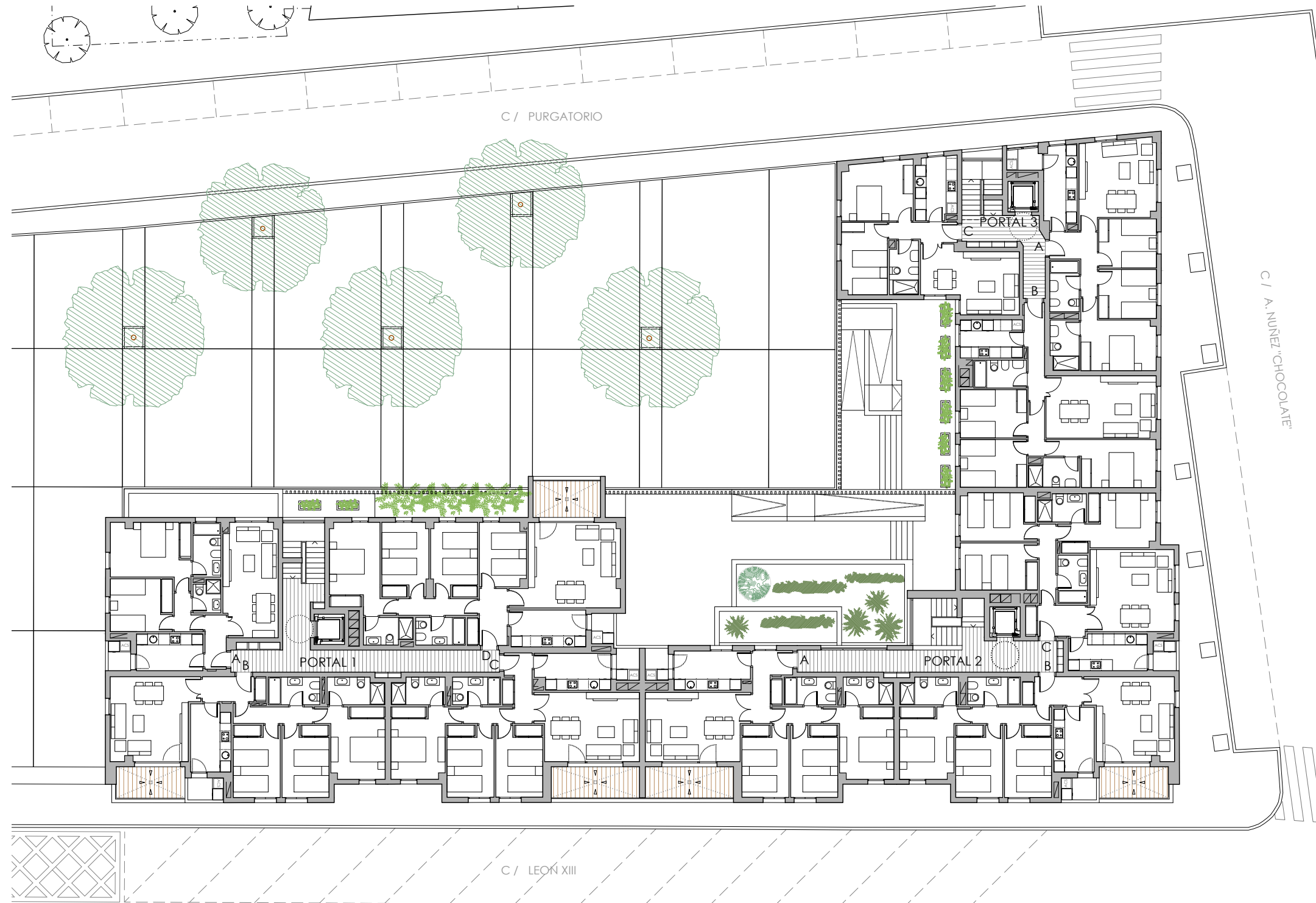
PLANTAS 3 Y 4. ESCALA 1:250

"EL PRESENTE DOCUMENTO ES DE CARÁCTER INFORMATIVO Y NO TIENE CARÁCTER CONTRACTUAL, PUDIENDO EXPERIMENTAR VARIACIONES POR EXIGENCIAS TÉCNICAS, JURÍDICAS Y/O EXIGENCIAS MUNICIPALES, SIN QUE ELLO IMPLIQUE MENOS CABO EN EL NIVEL GLOBAL DE CALIDADES. TODO EL MOBILIARIO, INCLUIDO EL DE LA COCINA, ES MERAMENTE INFORMATIVO. LOS GIROS DE LAS PUERTAS Y LA DISTRIBUCIÓN DE APARATOS SANITARIOS NO SON VINCULANTES. LAS SUPERFICIES EXPRESADAS SON APROXIMADAS, PUDIENDO EXPERIMENTAR MODIFICACIONES POR RAZONES DE INDOLE TÉCNICA EN EL DESARROLLO DE LAS OBRAS".